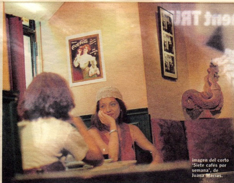
imagen del corto 'Siete cafés por semana', de Juana Macías.